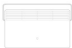
Chauffage * 1