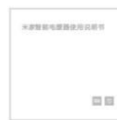
Manuel d'instructions * 1