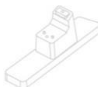
Support * 2