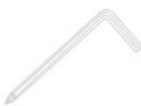
Tournevis * 1